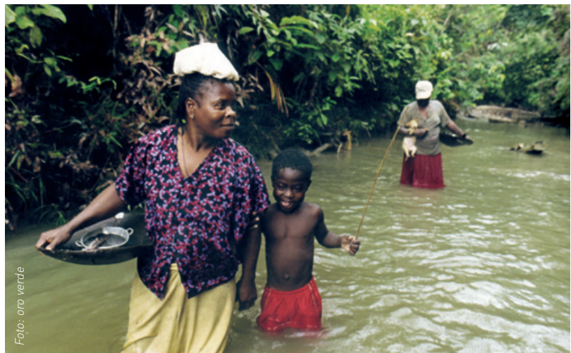
Grünes Gold: Im brasilianischen Chocó-Regenwald wird das erste zertifizierte Fairtrade-Gold der Welt geschürft, bei dem soziale und Umweltstandards garantiert werden.