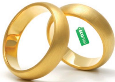
Ecofaire Trauringe aus Gelbgold 750 von Jan Spille.